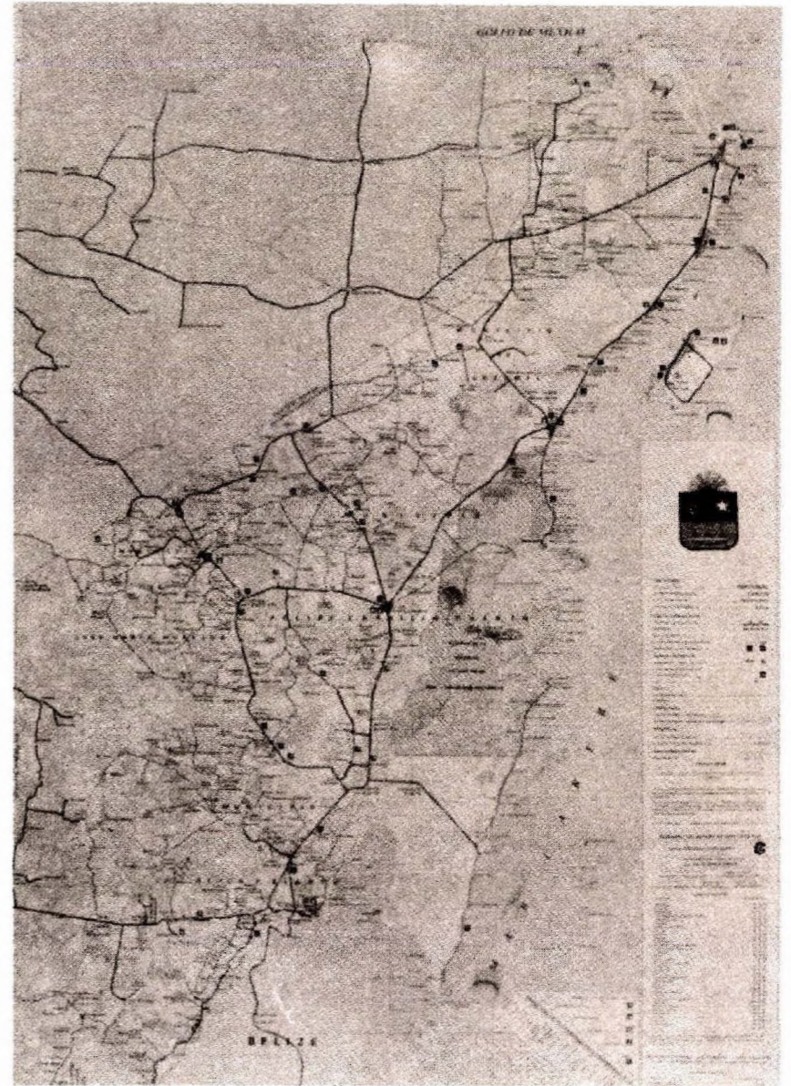
Carta Topográfica Estatal. Quintana Roo, 1992. Gobierno del Estado de Quintana Roo. Dirección General de Catastro. Escala 1:500 000